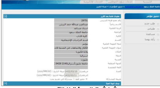
شاشة تعبئة التقرير

عند الضغط على أيقونة تعبئة التقرير تظهر للمستخدم شاشة تحتوي على المعلومات الخاصة لمعد التقرير و يقوم المعد بوصف المهمة العملية